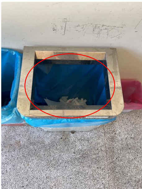
一般垃圾桶內部狀況*1