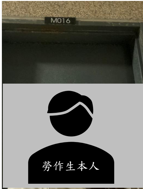
個人與教室編號牌含本人 清楚全臉自拍照 *1