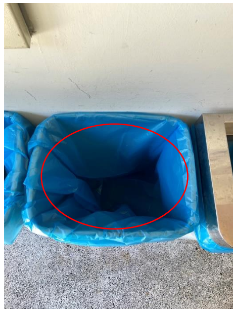
回收桶內部狀況(擇一即可)*1